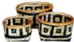
Bambu sepet: 32 TL, Altın Cadde.