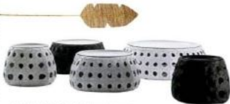
Yaprak dol, fiyat belli değil, Yargıcı Handworks, BBB Italia marka Patricia Urquiola tasarım Canasta setiçe: 1.727-2.407 Euro+KDV, Mizraik.