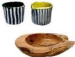
Seramik bardak: 95 TL, Aaliye 11, Ahşap kase: 269,95 TL, Zara Home.