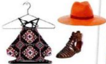
Bikini üstü: 79,95 TL, Berthka, Borsalino marka paçka: 1.625 TL, Beymen, Deri sandalet: 450 TL, Ayekin.