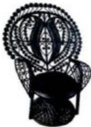
Berjer: 11.085 TL, Bouissa.

Dekorasyona acısından buluşmuş herkesin etkisine safari tarzı doyuncu kum beji, siyah ve beyaz üçlüsünden oluşan renk paleti, ol yuymu hasır ve ahşap aksesuarlar, vahşi yaşamı sembolize eden hayvanlar gelir. Havuzunuzun etrafını düzenlerken şıklık garantisli bu temaya başvurabilirsiniz.