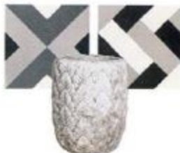
Kase: (metrekareli) 200-220 TL+KDV, Kara İstanbul, Leaves saksı: 236 TL, Mudo Concept.