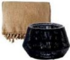
Şiş: 200 TL, Simple Life, Avenue sakar: 2.086 TL, L'unica.