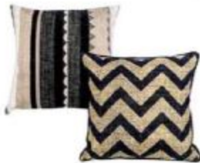
Salva yastık: 89,95 TL, Wazze yastık: 49,95 TL, Mudo Concept.