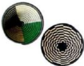
Dekoratif sepet: 110 TL, African Daydream, Dekoratif sepet: 150 TL, Duda Home.